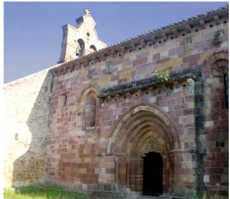
Iglesia de Santa María de Yermo (Cartes)