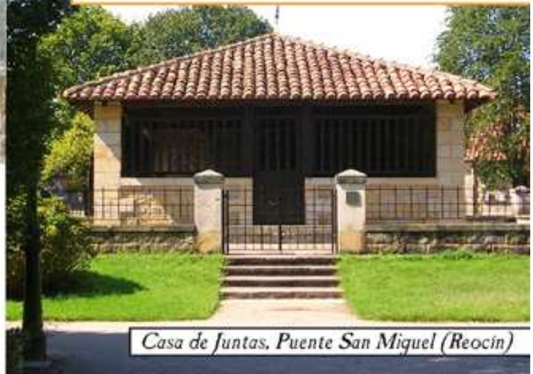
Casa de Juntas, Puente San Miguel (Reocín)

En Puente San Miguel se puede visitar, el 3 o miércoles de cada mes, el Jardín Histórico de la familia Botín, que está declarado Bien de Interés Cultural.