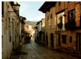
Santillana del Mar.

Si se han realizado, de forma individual en cada uno de los ayuntamientos y de forma conjunta a través de la Mancomunidad, diferentes actividades encaminadas a concienciar a la población en el respeto al medio ambiente y el desarrollo sostenible.