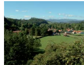
Vista general Reocín-Barcenaciones.

Al igual que en los otros dos municipios de la Mancomunidad, se han realizado distintas actividades y talleres medioambientales.