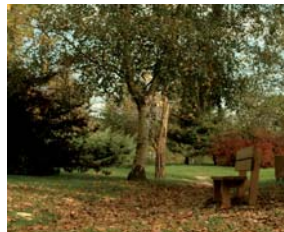
Parque El Anzar. Cartes.

Ese mismo año se iniciaron los estudios correspondientes a la realización del Diagnóstico Integral del Municipio; dichos estudios están a punto de concluir y a raíz de ellos se va establecer el Plan de Acción.