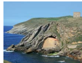
Ermita de Santa Justa. Santillana del Mar.